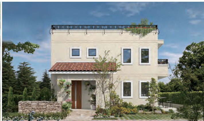
パルコン フルール