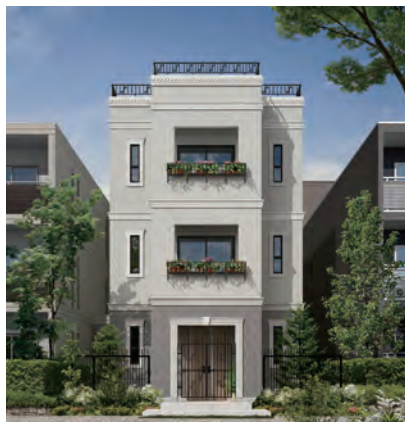
パルコン ノーブル