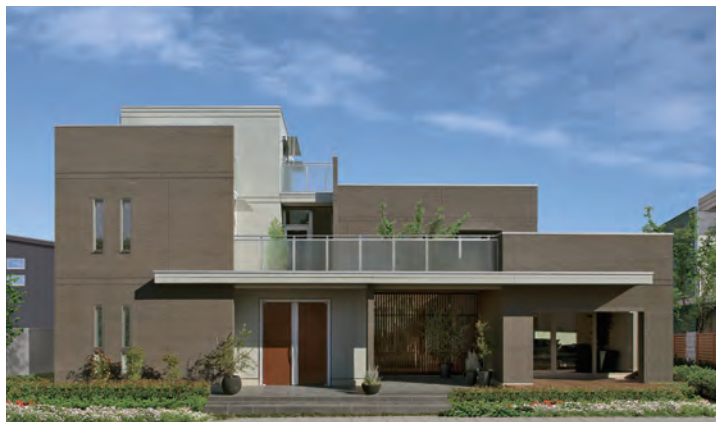
パルコン プレアリー