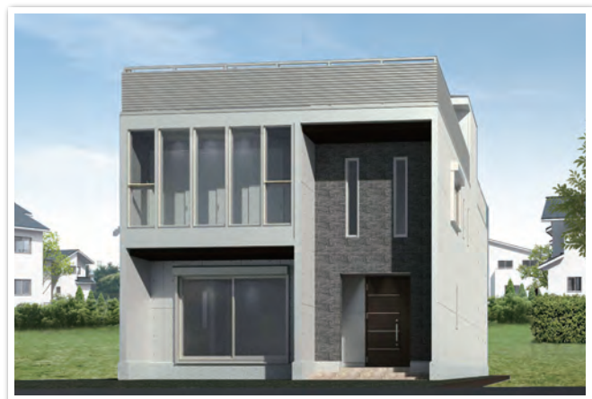
完成イメージパース

大成建設ハウジング設計施工の鉄筋コンクリート住宅「パルコン」が、閑静な住宅街堺区南三国ヶ丘町で建築中。完成してからでは見ることのできない構造をこの機会に、ぜひご確認ください！