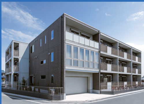
パルコン ウィズ 自宅・事務所・店舗兼賃貸マンション