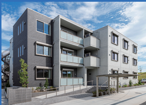
パルコン フレックス 賃貸マンション