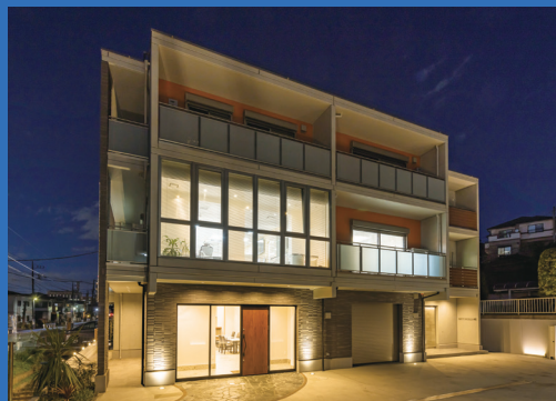
パルコン エステート 小規模事業用途建物